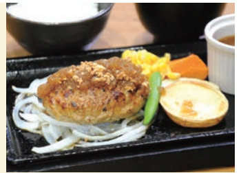
左:左から「麦太郎」「餃子浪漫」「黒ビール」(グラス・各640円) 右:「鉄板いぶし銀ハンバーグ (200g・ごはん・みそ汁付・1,380円)」。選べる3種から特製ガーリックオニオンソースを選択