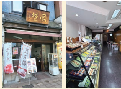
左:「和三盆ほうじ茶(850円)」。自家製の餡と、わらび餅のトッピングがほうじ茶の風味にマッチ