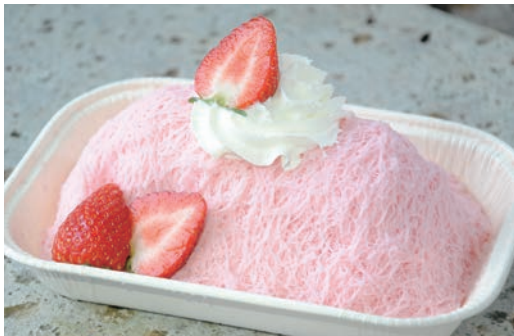
かき氷でもアイスクリームでもない、やさしい口どけ「大谷シルクピンス なつおとめ(通年販売・1,000円)」