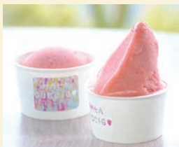
「なつおとめソルベ」のサイズは2種類、ピッコラ(左・540円)とソロ(右・650円)