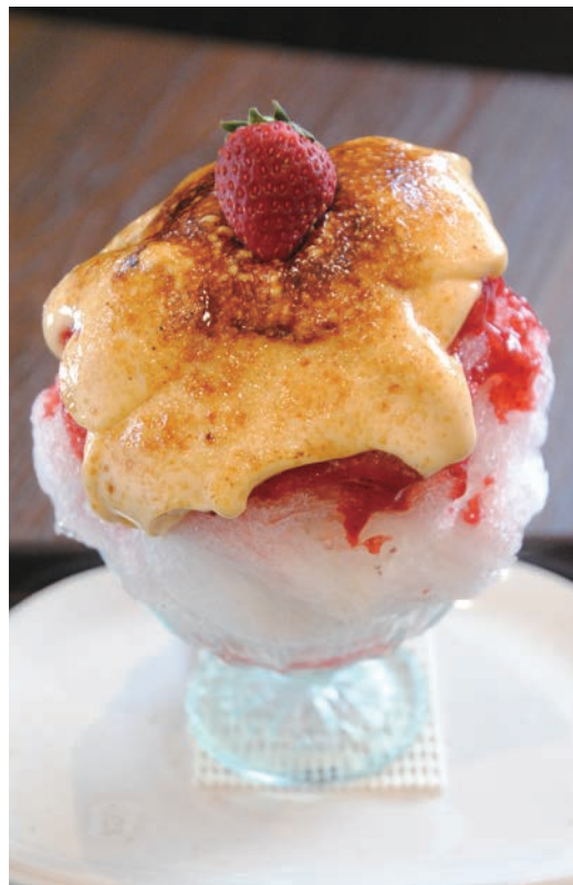
ケーキみたい!と話題の「ブリュレかき氷(1,000円)」。※フルーツとシロップは時期によって変わります。かき氷の提供は9月初旬まで