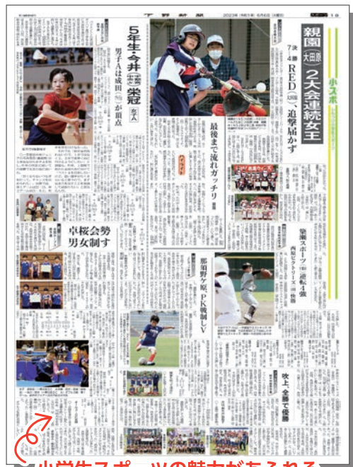
小学生スポーツの魅力があふれる「小スポ」