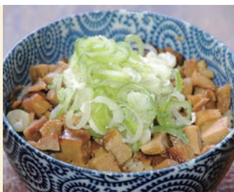
左:「濃厚とんこつ醤油ごちそうラーメン(1,050円)」 右:「チャーシュー丼(400円)」。 ミニサイズ、テイクアウトも大人気!