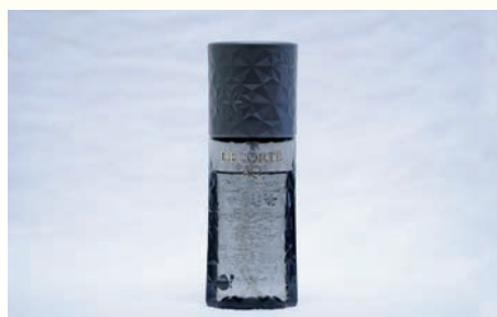
AQリプレニッシュヘアエッセンス 100ml 5,500円

スキンケアで定評のあるAQシリーズのヘアケアライン。美容液のように髪の芯まで浸透して速攻補修!ツヤやかでサラリとした上質な仕上がりを実現します。