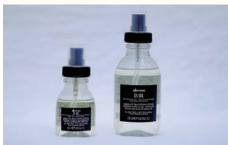
OIL OIL 50ml 3,520円 / 135ml 6,050円

「相反するものの調和」をコンセプトとするダヴィネスのヘアオイル。ベタつかない指通りながらふんわり仕上げ、理想の柔らかなツヤ髪をキープします。