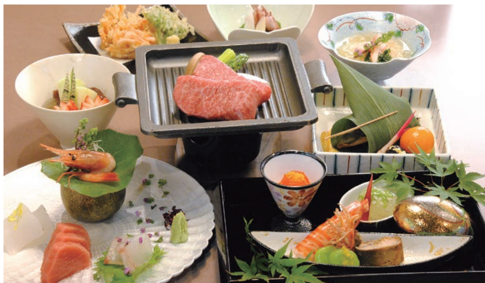
季節の食材によるコースの一例(このほか土瓶蒸し・握り寿司付・5,500円) ※予算応相談(4,000円~)