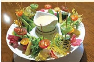
上:「刺身盛合わせ(3,850円)」の一例。※仕入れや要望により内容・盛り付けは変わります 下:「野菜のバーニャカウダ(1,265円)」

和食一筋の店主が、独学で西洋料理の技術を取り入れ、創作和食を提供。新鮮な魚介や珍しい野菜も「ワクワクしながら」自ら市場や直売店で買い付け。日々素材と向き合い、完成させる料理からは「喜んでほしい」の想いが伝わります。パフェのような「まぐろとアボカドのサラダ(要予約)」ほか、「本日のおすすめ」ボードにも人気メニューが満載。豊富なお酒メニューや温かなおもてなしも魅力。全室個室(2~12人用)8室なので、事前予約がお勧めです♪