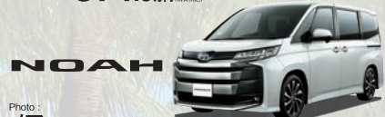
Photo: NOAH HYBRID S-Z (ハイブリッド・1.8L+モーター・2WD・7人乗り) ボディカラーのホワイトパールクリスタルシャイン(070)(33,000円)はメーカーオプション。本誌の価格には含まれておりません。 車両本体価格 367.0万円(消費税別)

Photo: VOXY HYBRID S-Z (ハイブリッド・1.8L+モーター・2WD・7人乗り) ボディカラーはマゼンタグレー(1L6)。 車両本体価格 374.0万円(消費税別)