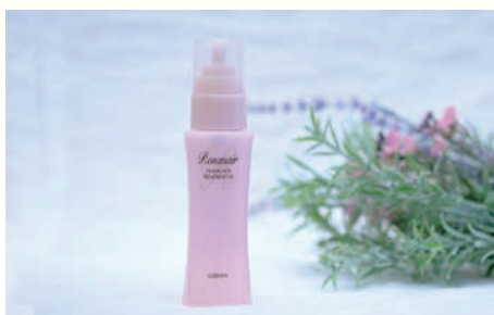
Renasair フレグランストリートメントオイル 50ml 3,080円

シャンプー類と同ラインで使用できるルネセアシリーズは、華やかなオリエンタルシプレの香りが特徴!髪の内部にリッチなうるおいを与え、しなやかな髪に。