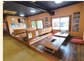
左:「和牛上カルビ(中央奥・1,628円)」「上タン塩(手前・1,650円)」。季節ごとに味付けが変わる人気メニュー「牛すじトマト煮込み(右下)」