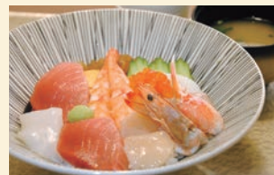
「上ちらし(茶碗蒸し・味噌汁付・1,980円)」

普段のランチに刺身付きの「焼き魚定食」「トンカツ定食」や、ちょっと贅沢な昼の会食に「刺身・天ぷら御膳」などの豊富なメニューを用意。美しい器や盛り付けに宴席も華やぐ「季節の食材によるコース(要予約・写真)」もお勧めです。粋なカウンター席やモダンなテーブル席、和室にテーブルを配した6名までの個室(2室)などもあるので、様々な用向きで心づくしの和食をご堪能あれ♪