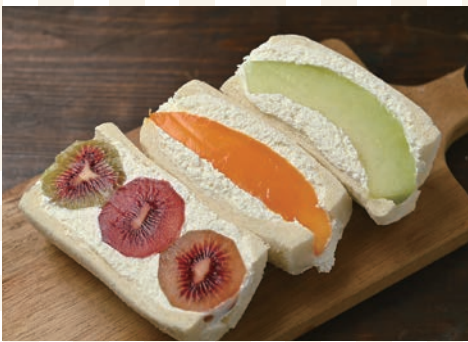
「フルーツサンド(各種600円~)」

真岡市を拠点に栃木県内を巡るキッチンカー「LUANA(ルアナ)」。ゴロッと入ったフルーツがインパクト大!のフルーツサンドが大人気です。写真は、手前から『ルビーレッドキウイ』『宮崎県産完熟マンゴー』『メロン』。旬のフルーツを使っているので、季節によってラインナップも変化。足を運ぶたびに新しい味に出会えるのも楽しみです。