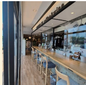
左:「デリプレート(自家製米粉パン付・1,200円)」。※旬ごとに野菜は変わります