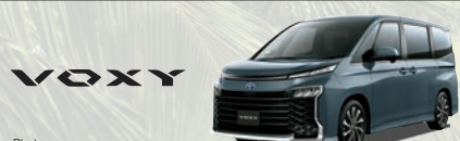
Photo: VOXY HYBRID S-Z (ハイブリッド・1.8L+モーター・2WD・7人乗り) ボディカラーはマゼンタグレー(1L6)。 車両本体価格 374.0万円(消費税別)

[本社] 栃木市西方町本城62-3 KONOHANA HOME ☎ 0120-895087