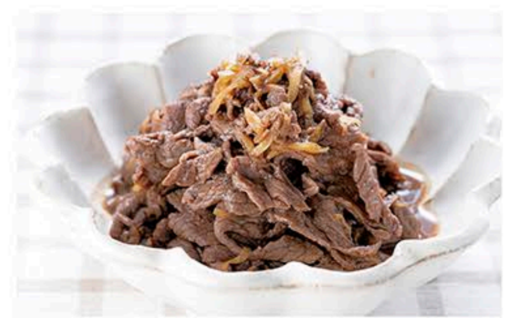
レシピ提供…JAふれあい食材