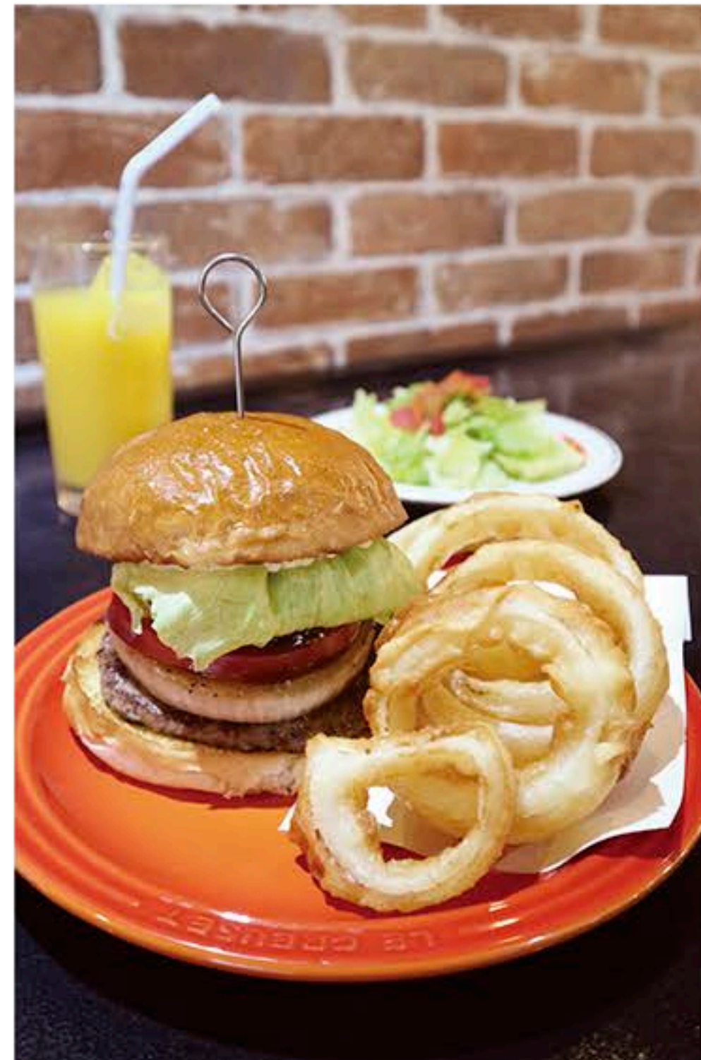
平日限定ランチセット「オニオンリングセット(サラダ、オニオンリング、ソフトドリンク付・1,300円)」+料金で好きなバーガーに変更可能