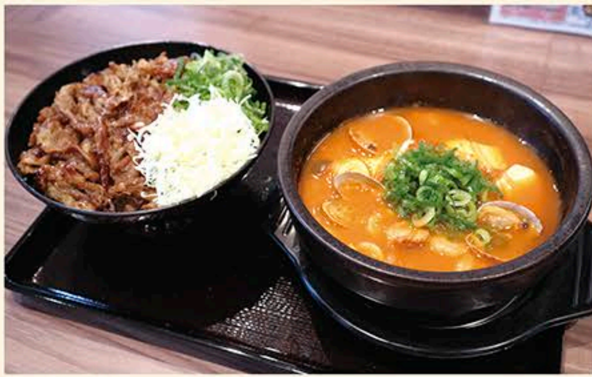
名物「カルビ丼(並590円)」と、人気の「海鮮スン豆腐(単品690円、定食850円・ごはん、おしんこ付)」。どちらもテイクアウトOK

カルビ丼とスン豆腐の専門店として京都で始まり急速に店舗数を増やし続けている話題の「韓井」。その70店舗目として2022年10月にオープンにした同店。店舗中央のオープンキッチンで網焼きされるカルビの香ばしい香りや音が店全体を包み込む臨場感！お手頃価格もうれしい、一人でも家族でも気軽に利用できる新感覚のファーストフード店です。