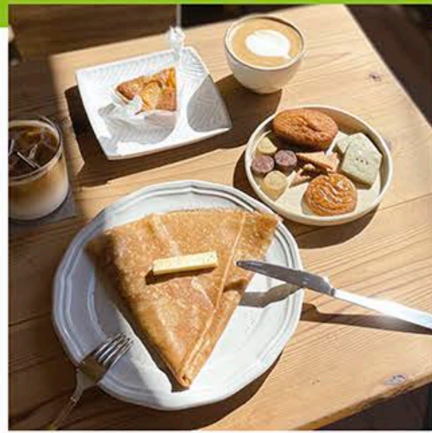
「おやつクレープ(550円〜)」

宇都宮市御幸ヶ原町143-190 028-680-6432 10:00~18:00(L.O.17:30) ※日曜のみ17:00まで(L.O.16:30) 休 水・木曜 P 6台