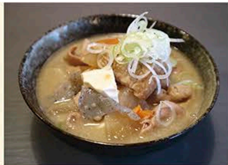
左：一番人気の「生姜焼き定食(880円)」 右：女性ファンも多い「もつ煮込み(単品600円、定食900円)」