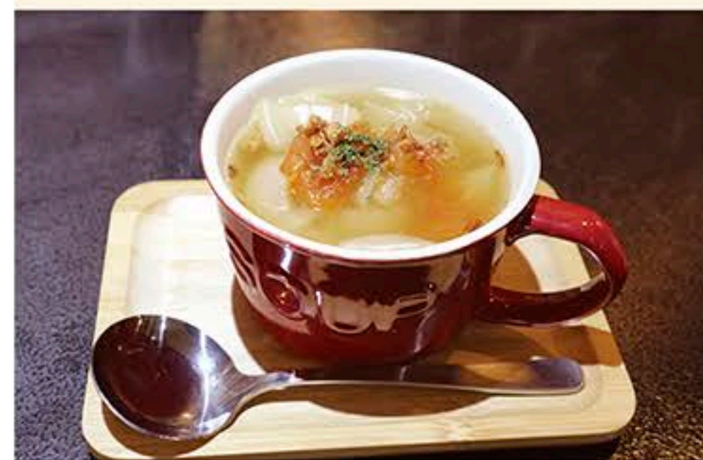
ランチセットに+200円で追加オーダー可能な「オニオンスープ(冬季限定)」