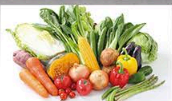
ベルテラシェ物産館