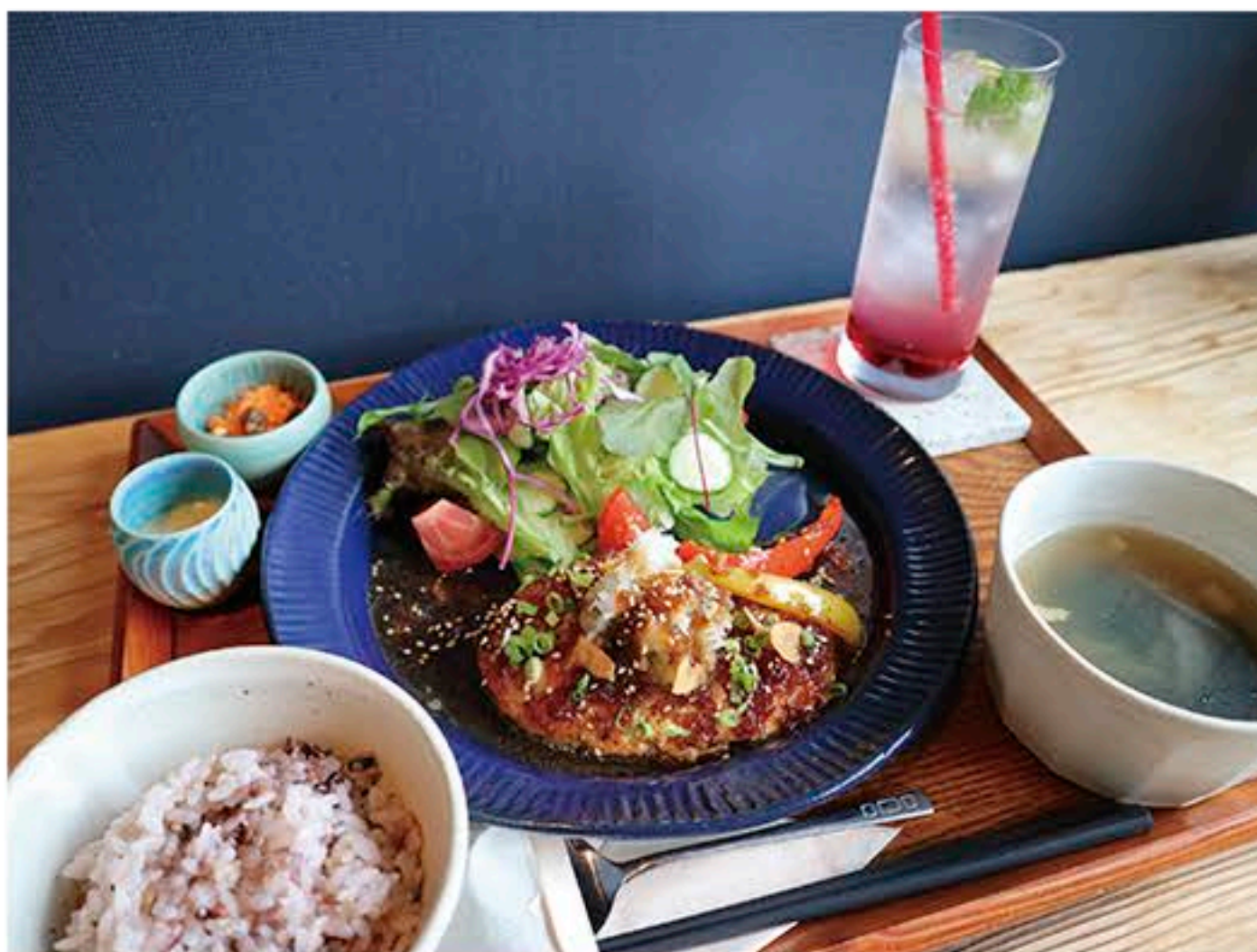
「日替わりプレートランチ・ドリンク付 (1,100円)」の豆腐ハンバーグステーキと克蘭ベリーソーダ