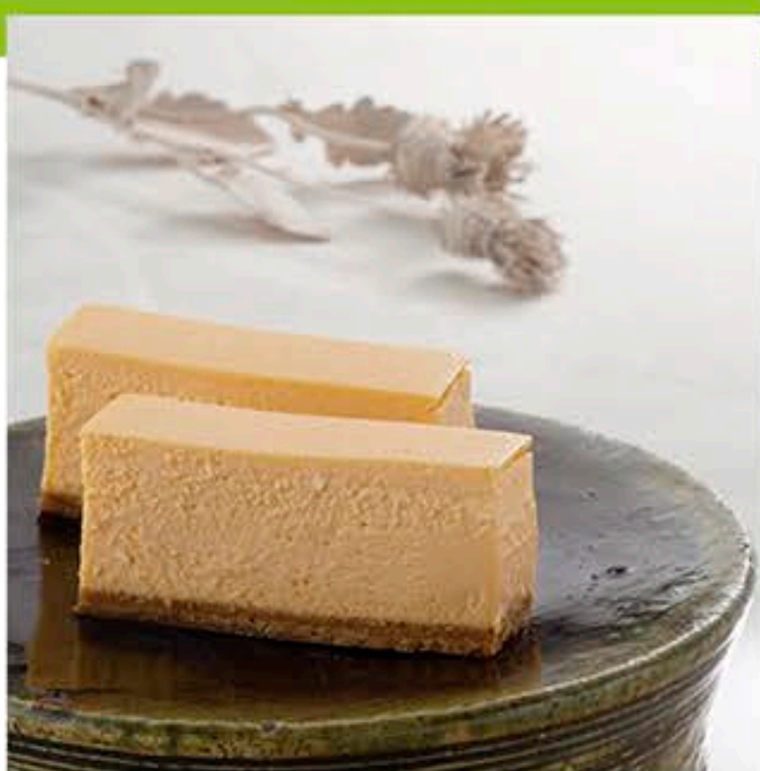
[85チーズケーキシリーズ(650円)]

宇都宮市宝木町2-802-1 1F 028-688-8685 11:00~19:00 休 木曜 P 8台