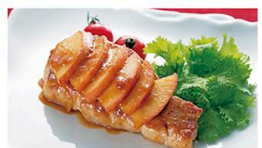
レシピ提供…JAふれあい食材