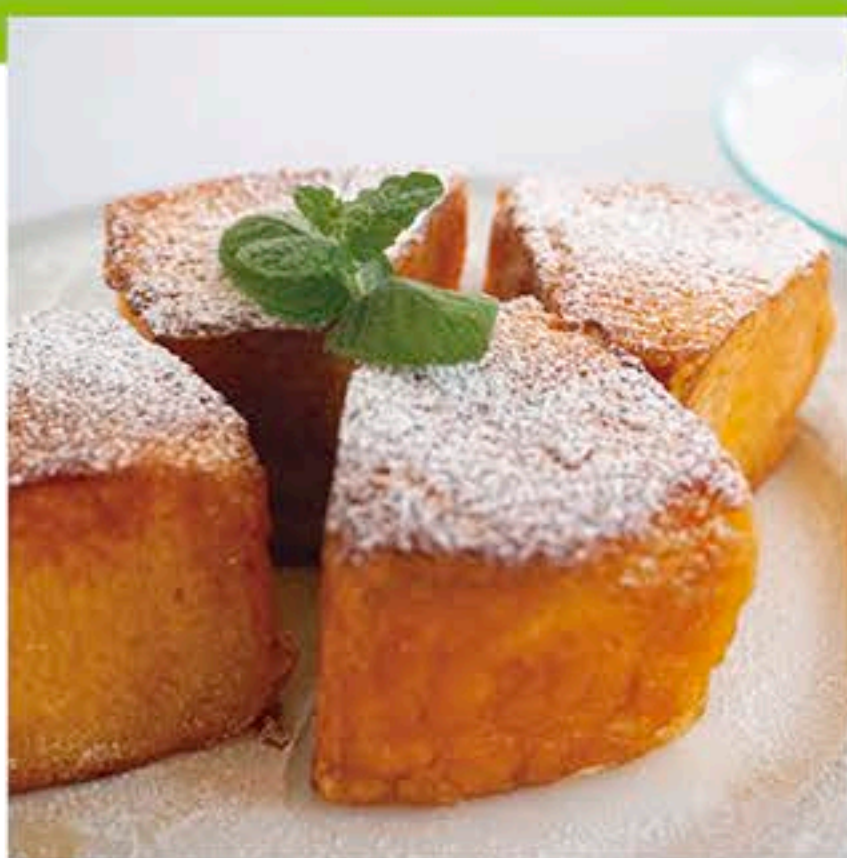
[フレンチバウム(600円)]

宇都宮市泉町6-22 028-612-4833 バウムハウスJURIN内 11:00~18:00(L.O.17:00) 休 火・日曜、祝日 P 3台