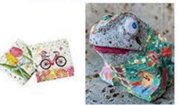
デコパージュ 絵付け

ここでしか得られない 大谷石を使ったクラフト体験!! お子さまから大人まで 楽しめます。