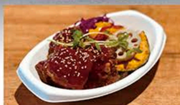
OYA PICK ROCK