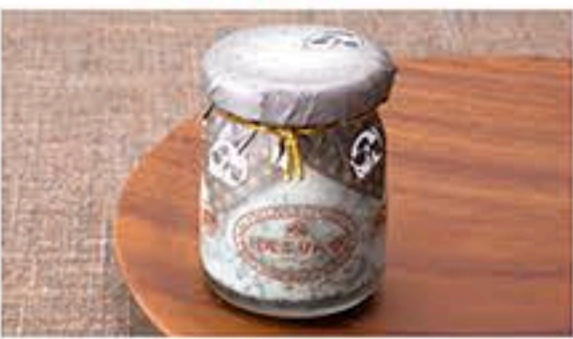
日光ふりん亭 大谷店