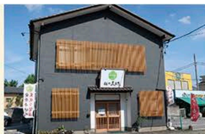
「特製生成り醤油そば (1,130円)」 トロトロ豚ばらチャーシューと柔らかレアチャーシューの2種盛りなどこだわりのトッピングが華やか! その日の限定メニュー(写真左)も見逃せません