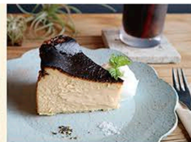
「バスクチーズ」(ケーキドリンクセット・800円)。ランチ注文の方は+500円でケーキ付に