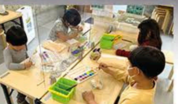
ベルテラシェ体験館