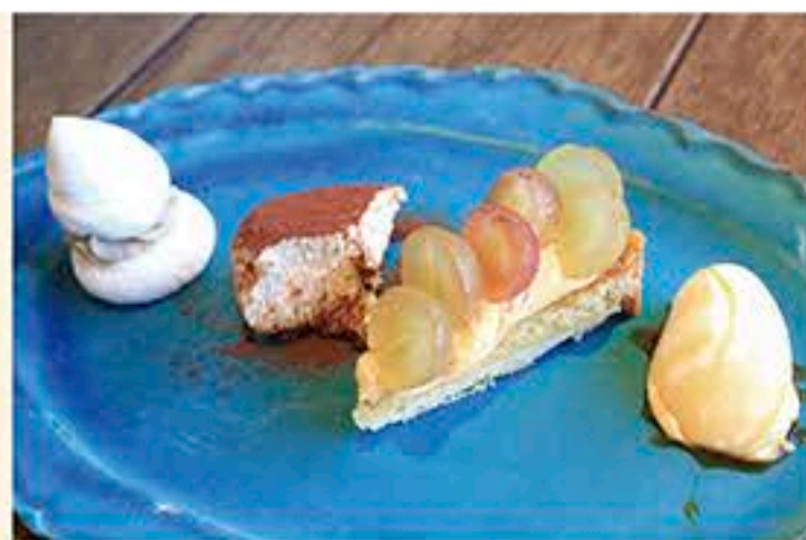
左:「みや美豚の挽肉とアスパラガスのカーチョエペ」 右:ランチコースに含まれる「ドルチェ4種盛り」モンテビアンコや季節のフルーツタルト