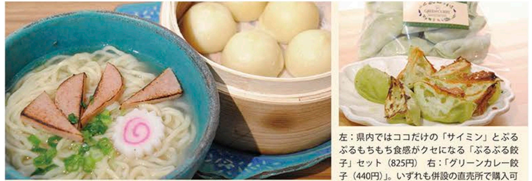
左：県内ではココだけの「サイミン」とぶるぶるもちもち食感がクセになる「ぶるぶる餃子」セット(825円) 右：「グリーンカレー餃子(440円)」。いずれも併設の直売所で購入可

FKDショッピングモール宇都宮 インターパーク店 1F LUPICIA ☎028-657-6100