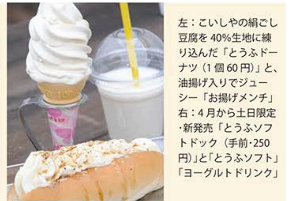
左：こいしやの絹ごし豆腐を40%生地に練り込んだ「とうふドーナツ(1個60円)」と、油揚げ入りでジュシー「お揚げメンチ」 右：4月から土日限定・新発売「とうふソフトドック(手前・250円)」と「とうふソフト」「ヨーグルトドリンク」