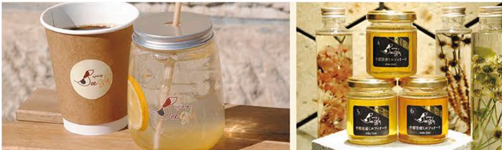
左: 週替わりハチミツ入り「コーヒー (410円)」と「レモネード (648円)」のほか、週替わりハチミツがたっぷりかかったソフトクリームもお薦め。右: 「宇都宮産ミルフィオーリ」は4・5・6月に採れる3種類。各ハチミツの素となっている花を使用したハーバリウムは園主の手作り

住所 宇都宮市旭1-4-32 ☎ 028-633-3335 営業 10:00~18:00(テイクアウトは11:00から) 休業 火曜(30日と祝日の場合は営業) P 4台 Instagram @aogenmiso