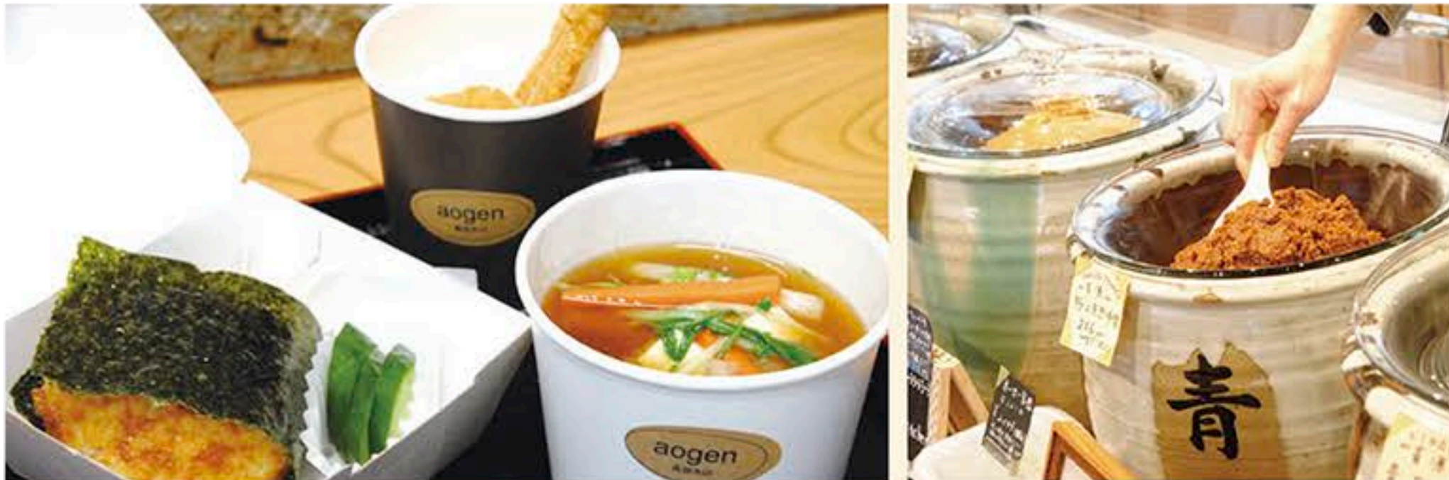
左:「青源セット (712円)」。「今週の生味噌」を塗ったおにぎり・味噌汁・生の甘酒 (アップル&シナモンに変更可。+108円) 右: 量り売りコーナー。「味噌の日=毎月30日」にはうれしいサービスも