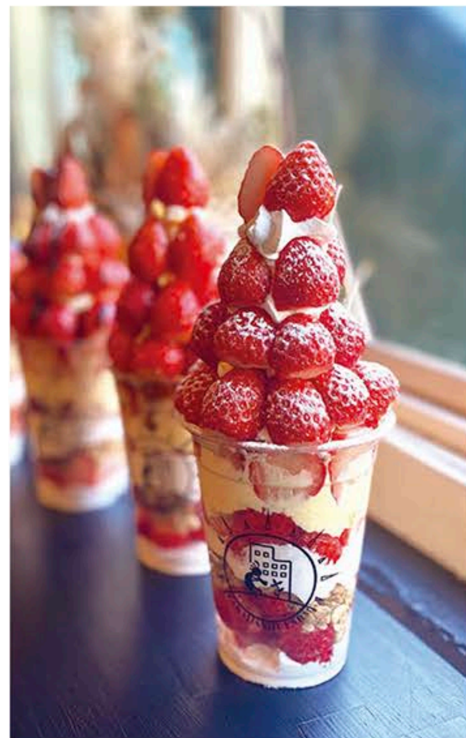
完熟苺を堪能「苺パフェMAX (1,400円)」。選べるソースや「苺1段増し (+200円)」でさらにゴージャスに♪

※2月取材時の店舗情報を掲載しております。新型コロナウイルス感染症の状況により、内容が変更される場合があります。営業時間等の詳細は各店舗にご確認ください。※紙面上の価格はすべて税込です。